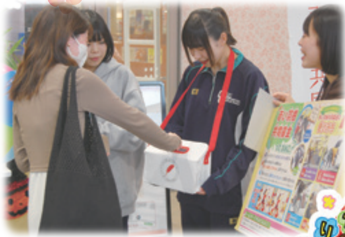
上田千曲高校生活福祉科