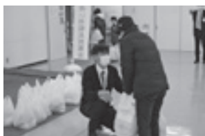
ささえあい年末市

令和5年度に申請のあった福祉関係施設やボランティア団体、上田市社会福祉協議会で行う各種事業等に活用されます。