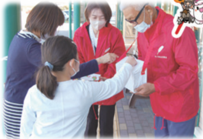
丸子ボランティア連絡協議会