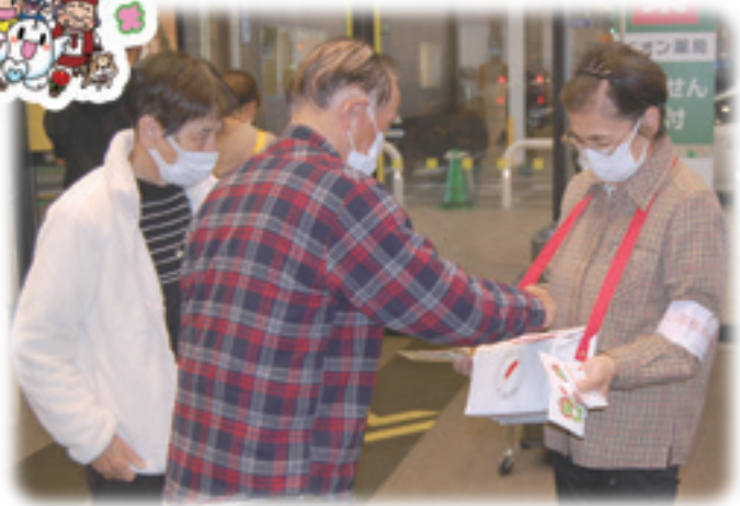
ボランティアグループ でんでん虫の会