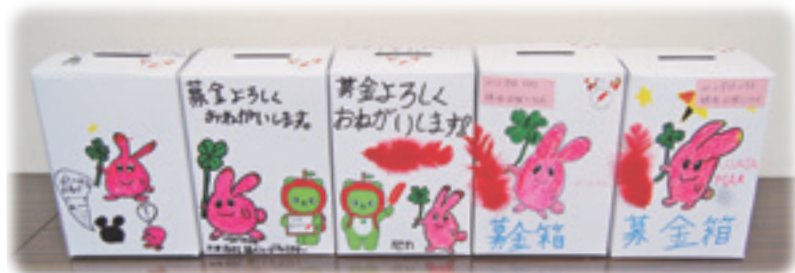
職場体験に来所した上田市立北小学校児童が作成した募金箱