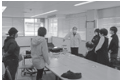
写真転写機の説明