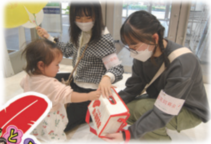
上田高校 カンボジア街戸プロジェクト