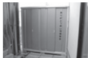
中吉田自治会防災倉庫