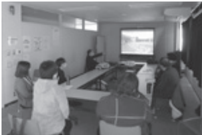
写真加工を習いました