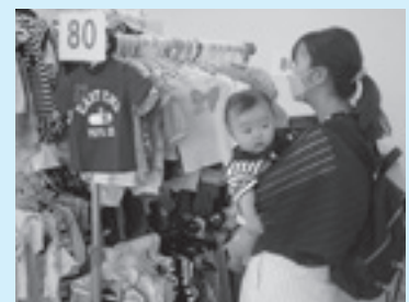
ふくふくひろばの様子