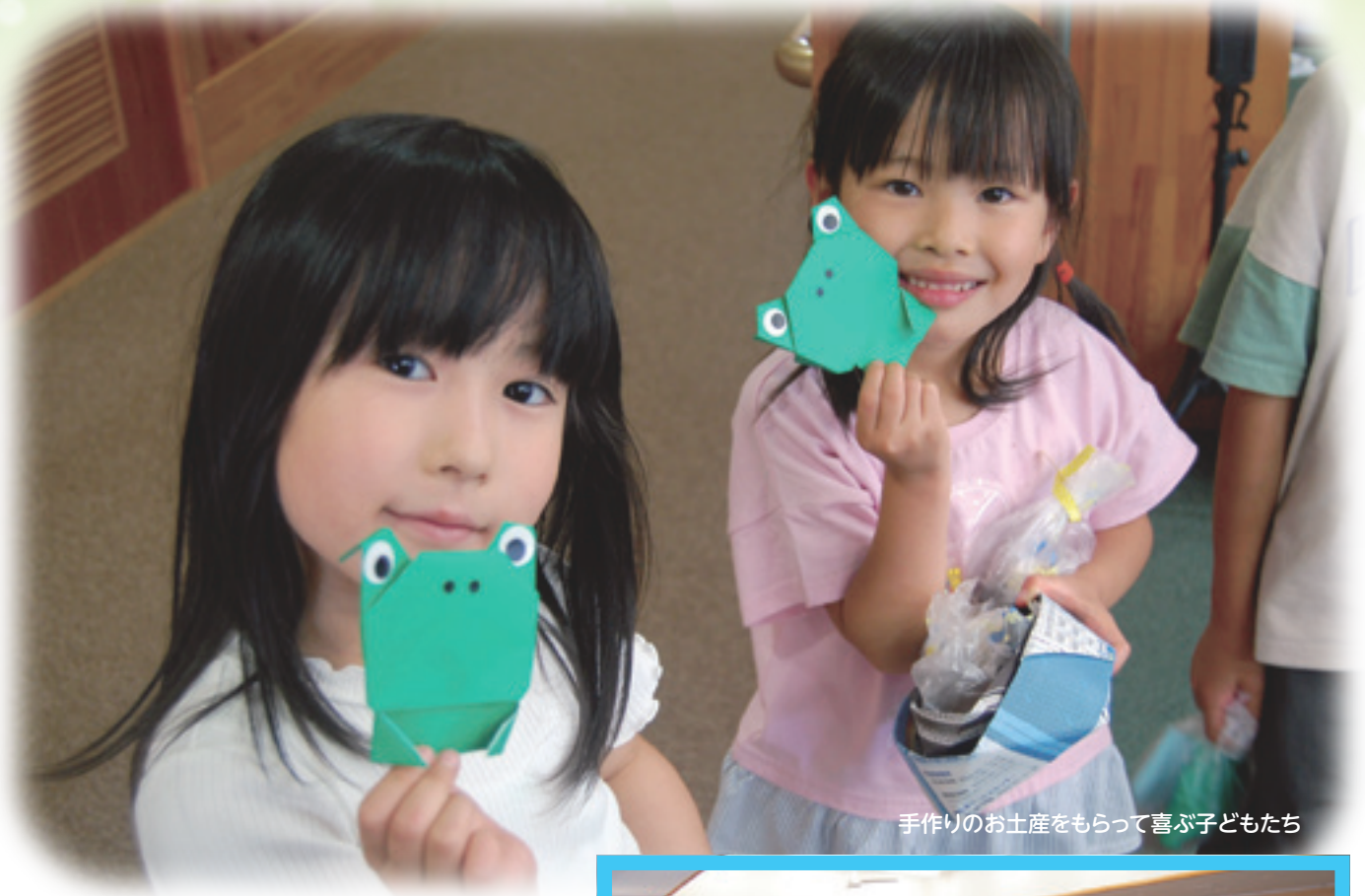
手作りのお土産をもらって喜び子どもたち