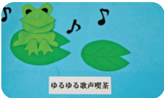
ゆるゆる歌声喫茶