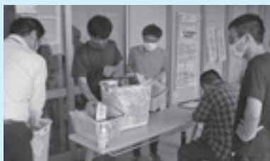
フードドライブの様子