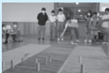
中学校でのモルック体験の様子