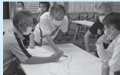
住民支え合いマップ説明会