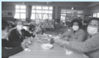
デイサービスセンター／レクリエーションの様子