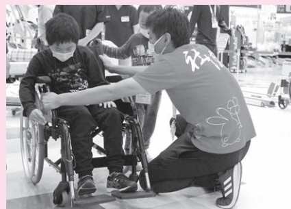
「ふくしの魅力を子どもたちに伝える『ふくしニア』」の様子

皆さまからご協力いただいた共同募金は、福祉施設やボランティアグループ・福祉団体等の活動を応援するために活用されます。(令和5年度の申請については8ページ参照)