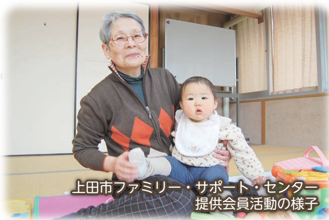
上田市ファミリー・サポート・センター 提供会員活動の様子