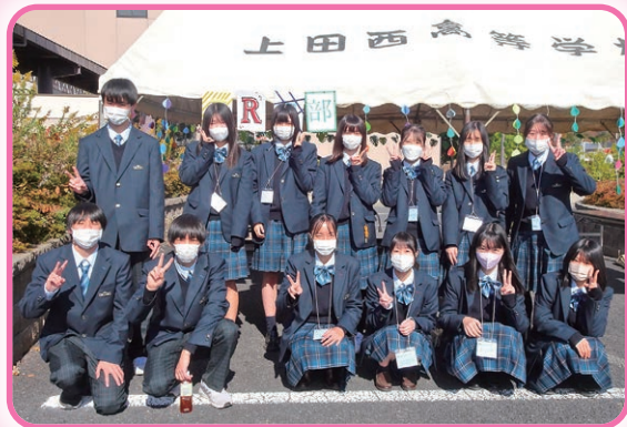
上田西高等学校 JRC 部の皆さん