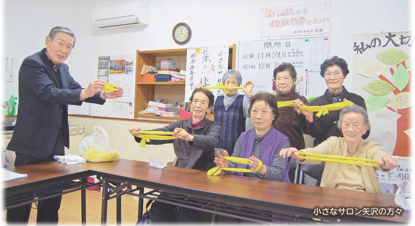
小さなサロン矢沢の方々