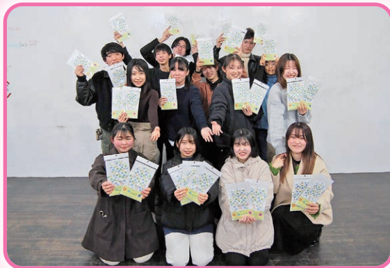
ハナサカ軍手ィプロジェクトの皆さん

平成 19 年（2007 年）の冬に「長野県の寒い冬を暖かく、街を華やかに!」という想いからスタートし、平成 21 年（2009 年）に「軍手ィ」が誕生しました。「軍手ィ」の販売による収益で、「ちび軍手ィ」を製作し、毎年上田市を中心に長野県内の小学校 1 年生に、「ちび軍手ィ」をプレゼントしています。小学校を訪問してプレゼントする際、遊びを通してふれあうことで、「笑顔」も一緒にお届けしています。