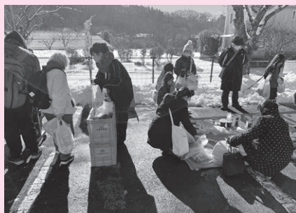
「さなだおすそ分け会」の様子