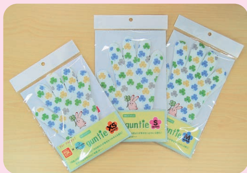
定価 600 円（税込）