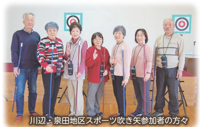
川辺・泉田地区スポーツ吹き矢参加者の方々