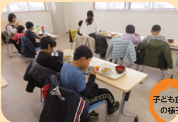
子ども食堂 の様子