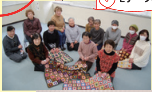
◀上田モチーフの会