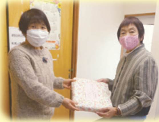
▶丸子モチーフの会