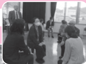
「傾聴ボランティア・まるこ」 フォローアップ研修会の様子