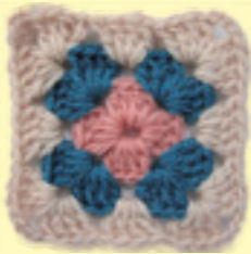
一つひとつ丁寧にモチーフを編み

市民の方々から寄せられた毛糸でモチーフを編み、繋ぎ合わせてひざ掛けにし、年に一度、対象地区の一人暮らしの高齢者や障がいのある方などに民生委員・児童委員さんを通してお配りしています。