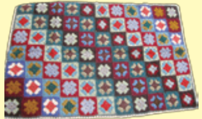
17枚のモチーフをつなぎ合わせてひざ掛けの完成

★膝掛けが贈られた方からの声★ 受け取られた皆さまには大変喜んでいただいています。