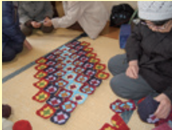
受け取り手の喜ぶ顔を思い浮かべながら配色を考え